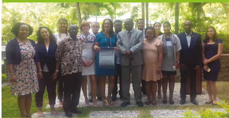
Concertation des experts représentant les petits États insulaires en développement dans le cadre de l'initiative de la Francophonie sur le tourisme durable, 20 – 22 septembre 2017, Mahé, Seychelles