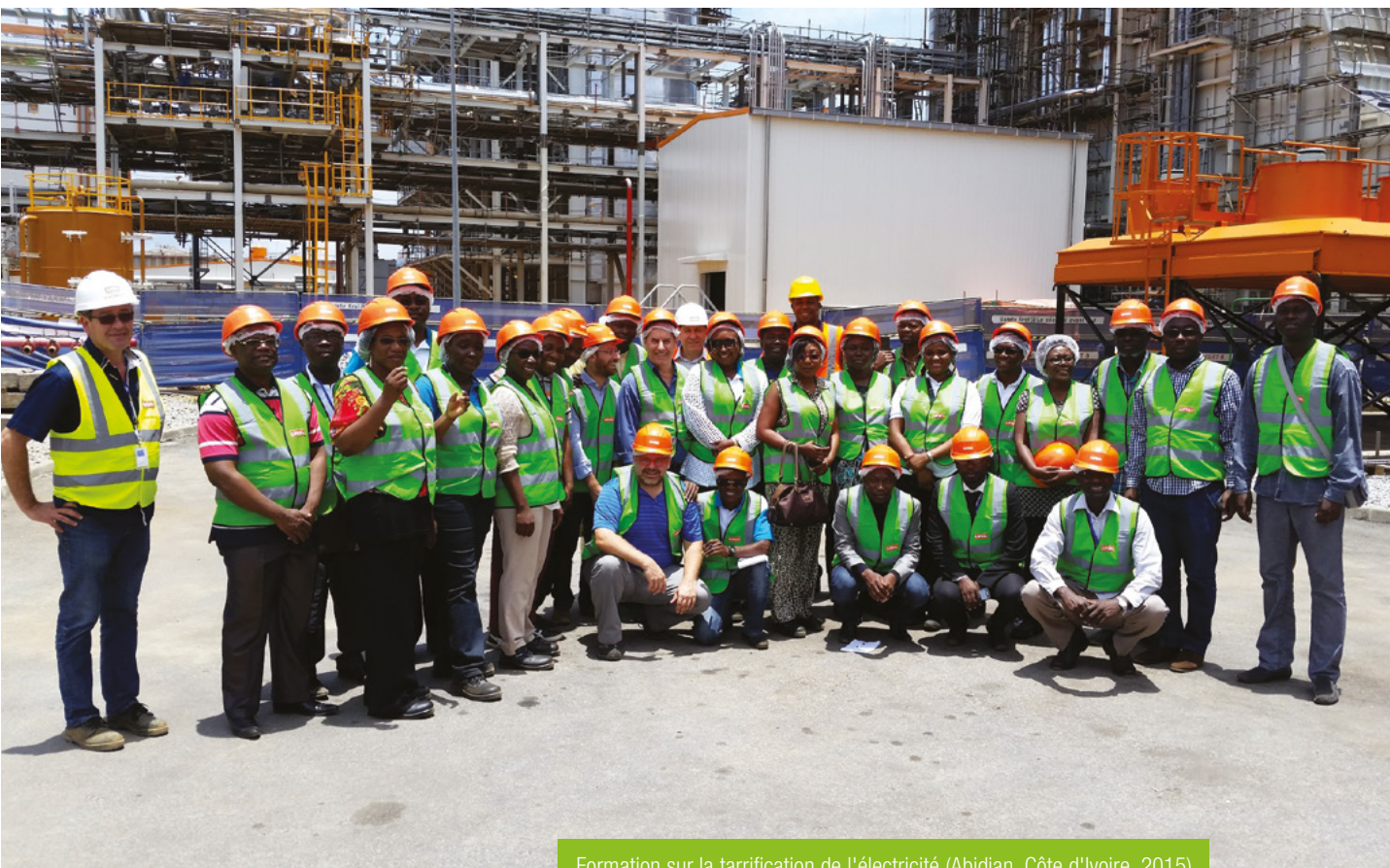
Formation sur la tarification de l'électricité (Abidjan, Côte d'Ivoire, 2015)

Le renforcement des capacités de sensibilisation et de plaidoyer de la société civile francophone dans le secteur de l'énergie.