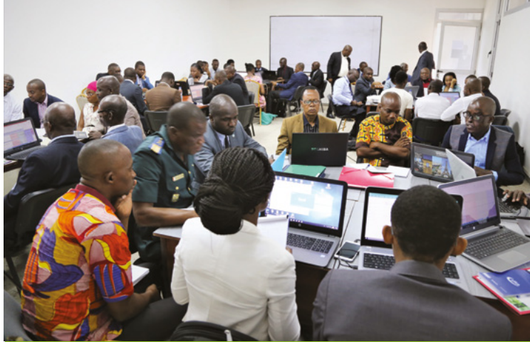
Atelier de formation des cadres de la direction générale de l'environnement et du développement durable du ministère de l'Environnement sur les outils ASD (priorisation des cibles des ODD), Abidjan (26 février – 02 mars 2018)

En collaboration étroite avec les Unités hors siège (UHS), au Gabon (BRAC), 52 maires ont été formés sur les ODD et l'Agenda 2030 en appui au PROFADEL. Une formation régionale a été réalisée en Bulgarie en partenariat avec le BRECO, avec la participation d'une vingtaine d'experts des pays de la région). Un appui a été apporté au BRAO pour sa rencontre régionale de 12 correspondants nationaux à Lomé.